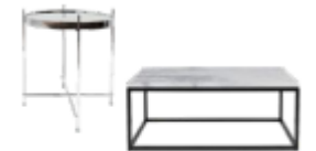
Couch- und Nachttisch